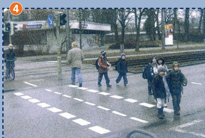
Ampelanlage bei der Stadtparkasse, Arnulf-/Nibelungenstraße