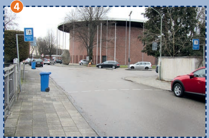
Verkehrshelferübergang Gotthelf-/Stuntzstraße Durch Schulweghelfer gesichert.