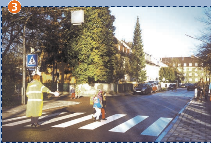
Fußgängerüberweg Stuntzstraße Durch Schulweghelfer gesichert.