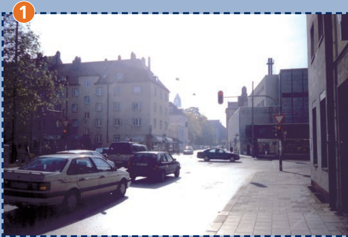
Kreuzung Landsberger Straße/Bäckerstraße