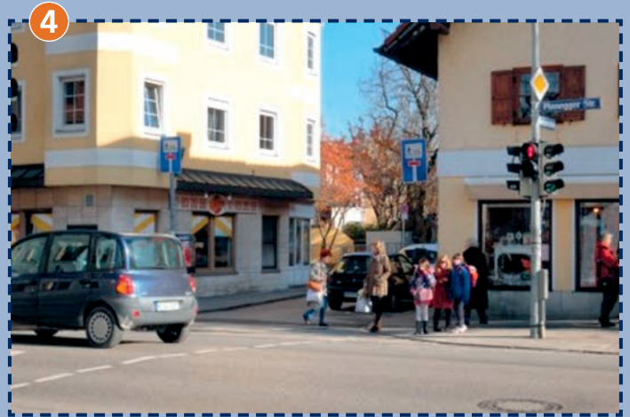
Planegger Straße/Am Kloostergarten/Bodenstedtstraße