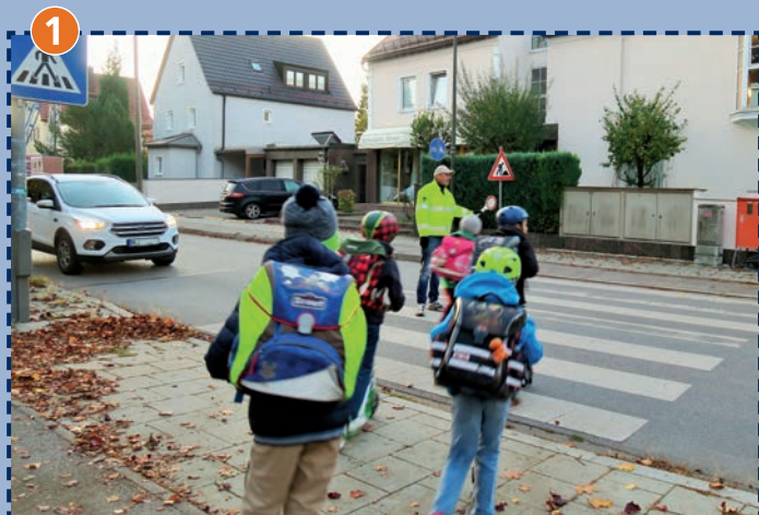
Fußgängerüberweg Lochhamer Straße/Spindlerplatz