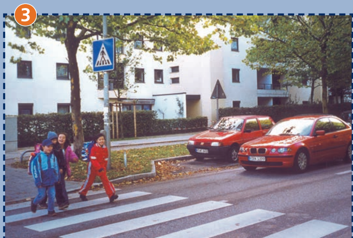
Fußgängerüberweg Fritz-Kortner-Bogen/Therese-Giehse-Allee (Südseite)