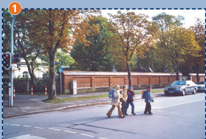
Fußgängerampel an der Putzbrunner Straße