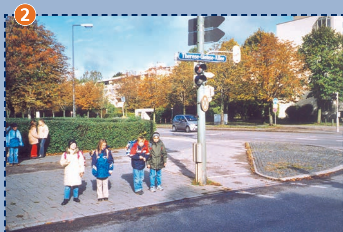
Kreuzung Therese-Giehse-Allee/Putzbrunner Straße (Ampel)