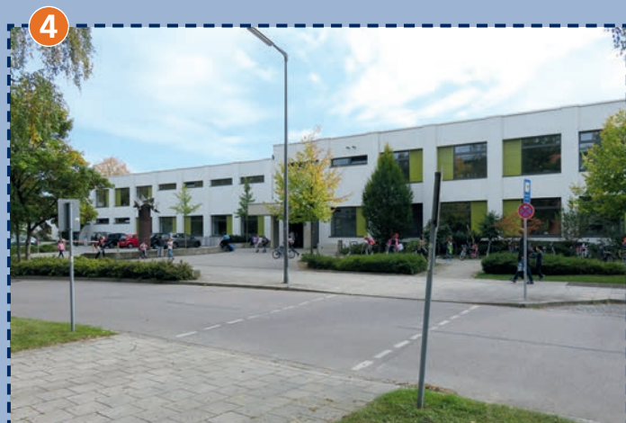
4 Übergang an der Regina-Ullmann-Straße Blick nach Süden direkt auf den Eingangsbereich der Schule