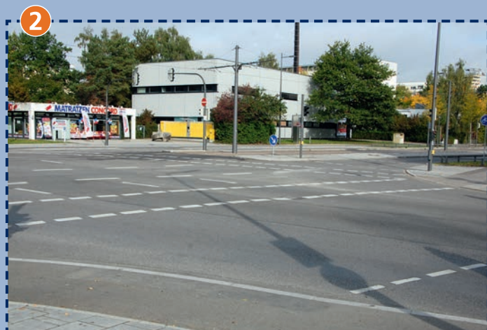
2 Kreuzung Johanneskirchner Straße/Cosimastraße Blick nach Nordwesten