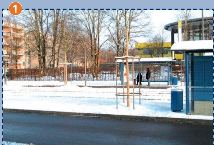
1 Straßenbahn- und Bushaltestelle Regina-Ullmann-Straße Blick nach Osten