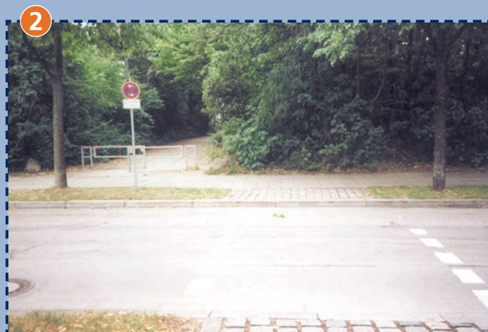
2 Ausgang Ravensburger Ring (Mitte Schul-Hauptausgang, nur morgens mit Schulweghelfer/-in besetzt)