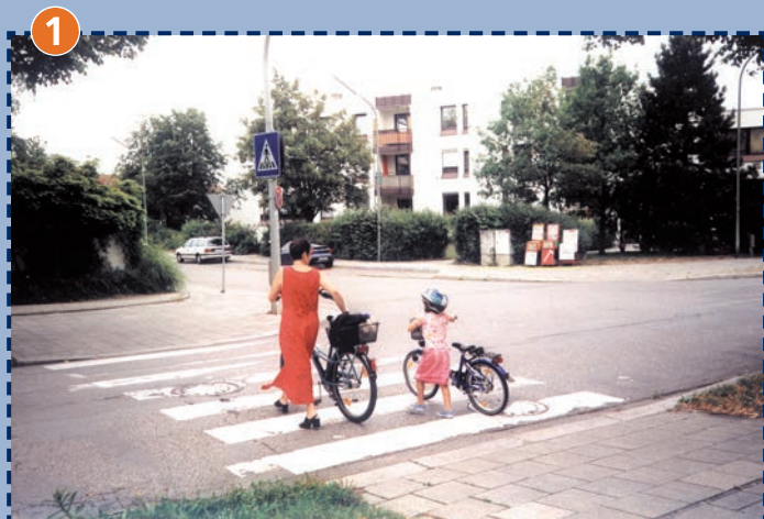
1 Fußgängerüberweg Ravensburger Ring/Krögelsteinerstraße