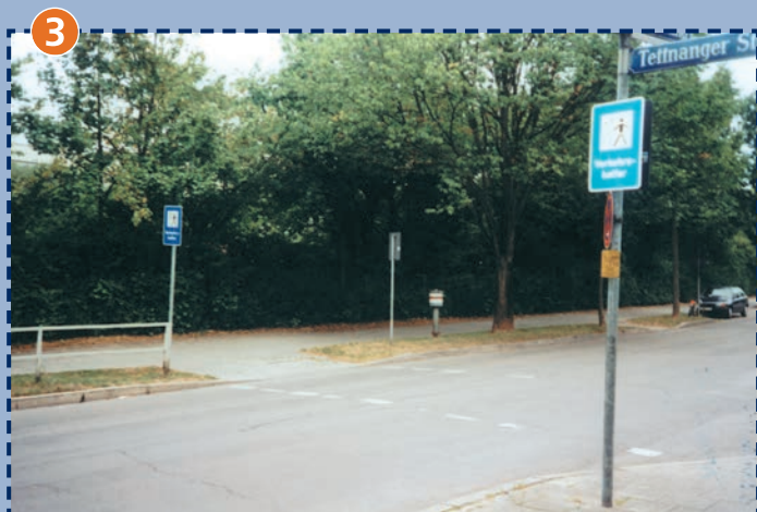
3 Verkehrshelferübergang Ravensburger Ring/Tettmanger Straße (zweiter direkter Schulausgang, nur morgens mit Schulweghelfer/-in besetzt)