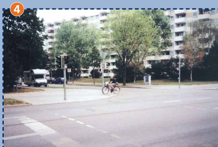
4 Ampelanlage Aubinger Straße/Ravensburger Ring