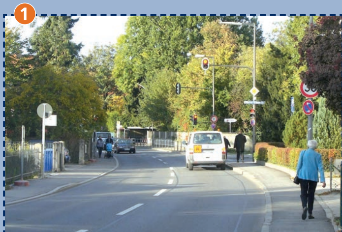
Kreuzung Eversbuschstraße/Pfarrer-Grimm-Straße (mit Ampelanlage)