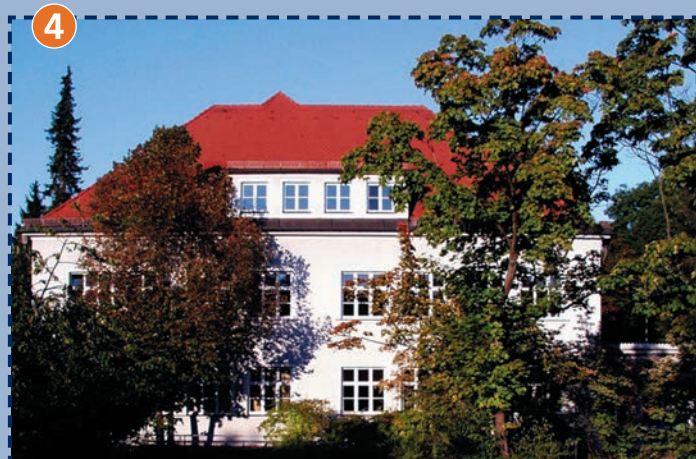
Unsere Schule an der Pfarrer-Grimm-Straße