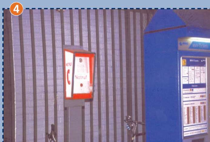
Notrufsäule im U-Bahnhof Olympiazentrum