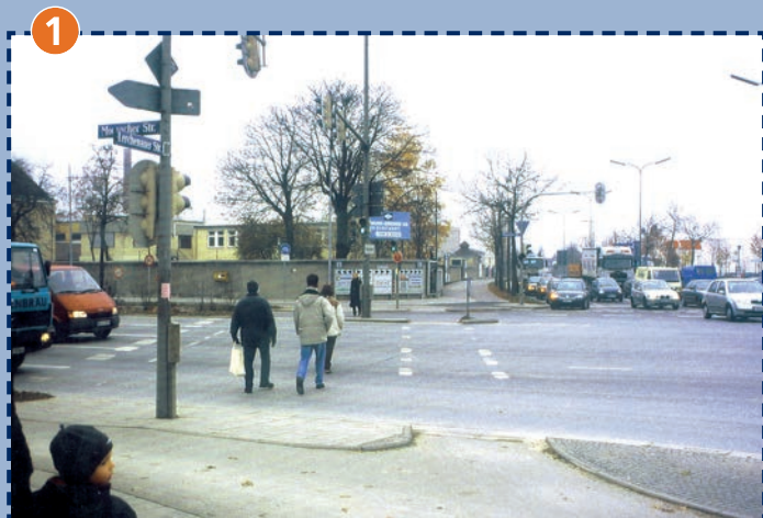
Straßenkreuzung Moosacher Straße/Lerchenauer Straße