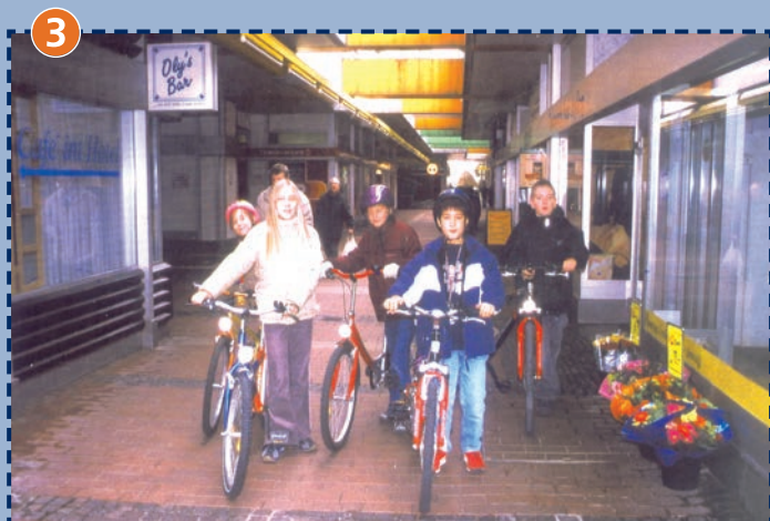
Ladenstraße im Olympischen Dorf: Radfahrer bitte absteigen! Achten Sie darauf, dass sich Ihr Kind nicht in den unterirdischen Fahrstraßen aufhält!