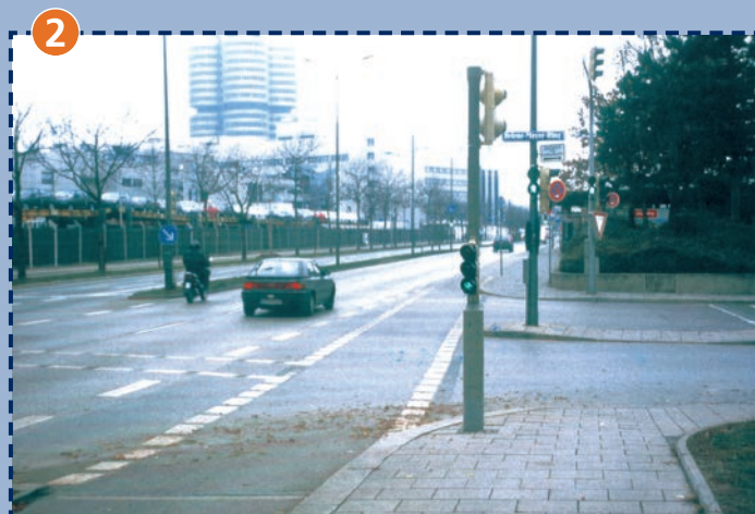
Einmündung Lerchenauer Straße/Helene-Mayer-Ring