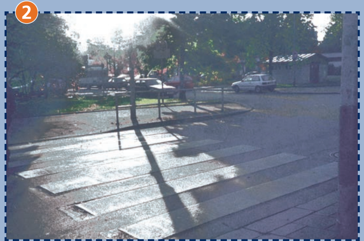
Fußgängerüberweg Kurt-Eisner-Straße schräg gegenüber der Schule. Vorsicht: Einmündung der Max-Kolmsperger- Straße!