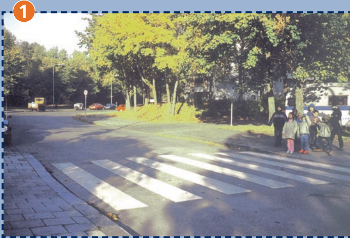
Fußgängerüberweg Kurt-Eisner-Straße/Brittingweg Vorsicht: unübersichtliche Kurve!