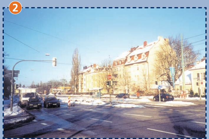
Menzinger Straße/Nördliche Auffahrtsallee Standort Schulweghelfer