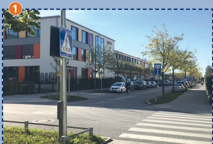
Zebrastrreifen in der Margarethe-Danzi-Straße