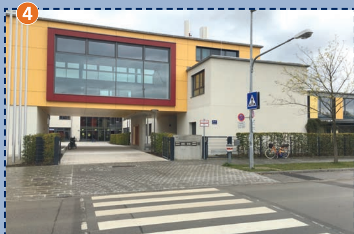
Zebrastrreifen vor dem Eingang zur Grundschule