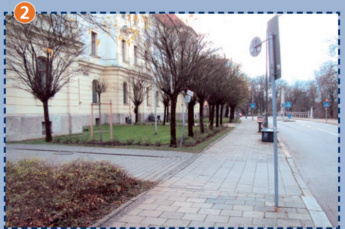
Hofeinfahrt der Schule