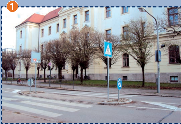
Zebrastrreifen vor der Schule