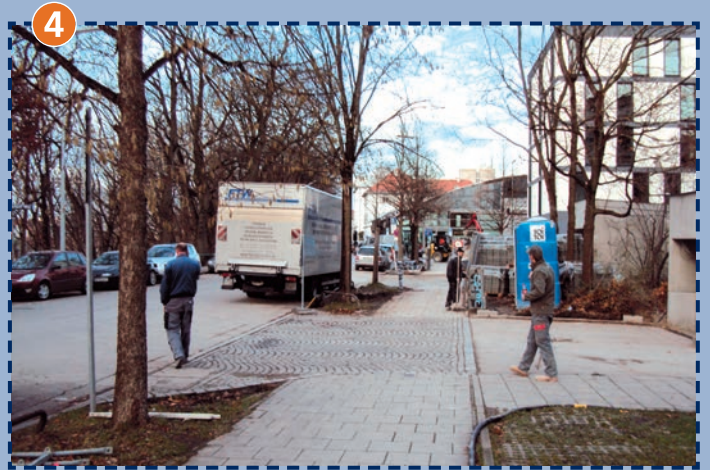
Ausfahrt aus einer Tiefgarage an der Hochstraße