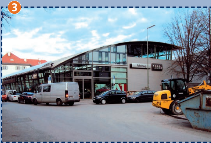
Einmündung Rablstraße in die Hochstraße