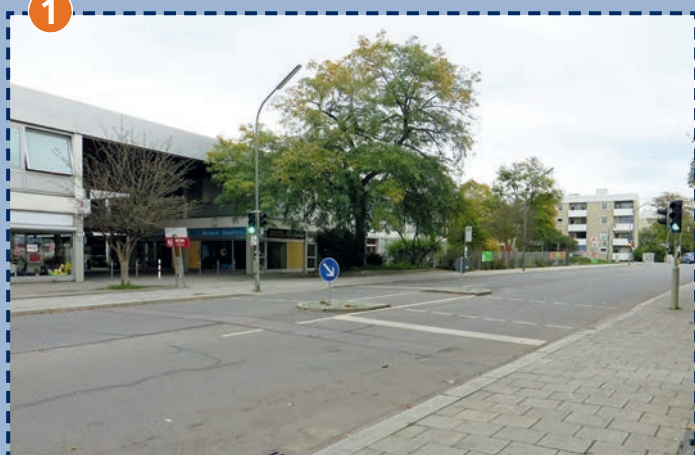
Fußgängerbedarfsanlage Wiesentfeller Straße: bitte Knopf drücken und nur bei „Grün“ überqueren!