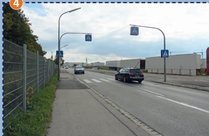
Den Zebrastreifen nur überqueren, wenn der Verkehr steht (Achtung Busverkehr) oder kein Fahrzeug in Sicht ist.