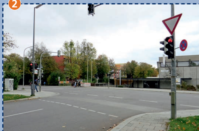
Kreuzung Wiesentfeller Straße/Riesenburgstraße: mit Ampelanlage, Busverkehr – bitte besondere Vorsicht!