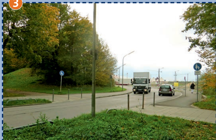
Das Überqueren der Wiesentfeller Straße vor (ungesichert) und hinter der Kurve (Zebrastreifen) ist gefährlich.