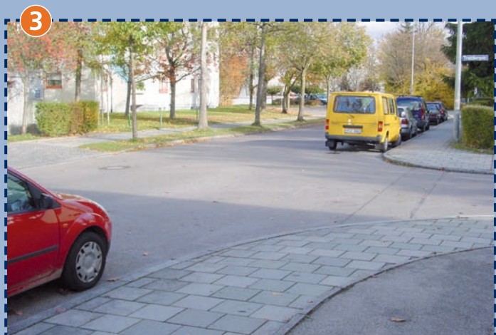
Beispiel für viele Rechts-vor-Links-Straßen im Schulsprengel