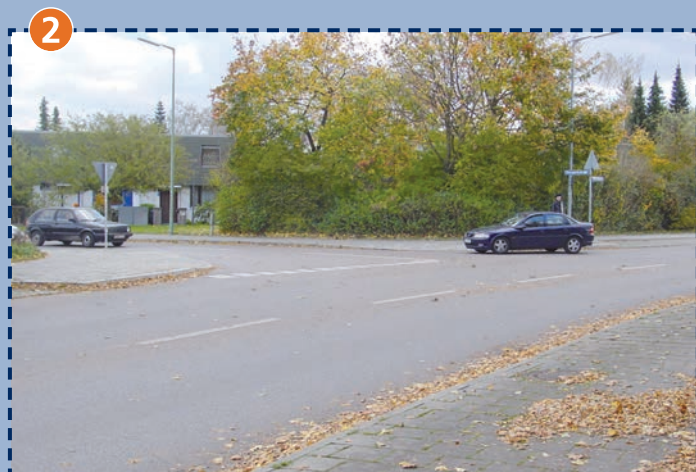
Unübersichtliche Einmündung der Kurparkstraße in den Stiftsbogen