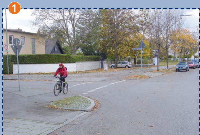
Einmündung der Kornwegstraße in die Gardinistraße