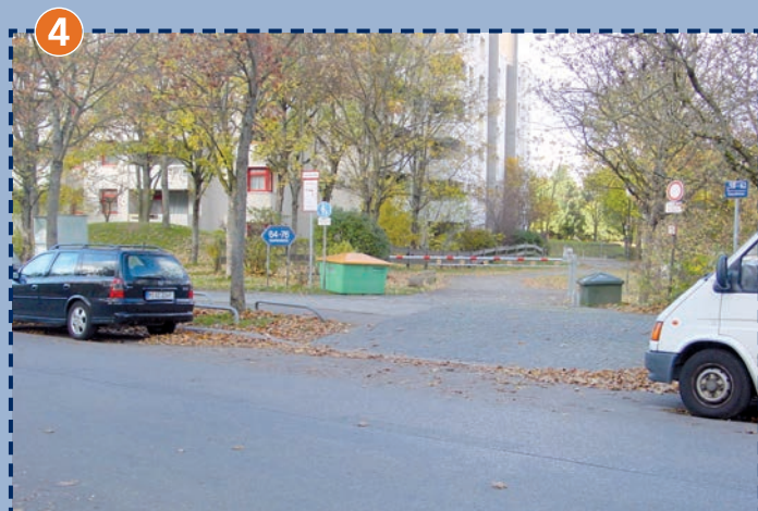
Einfahrt zur Schule von der Gardinistraße aus