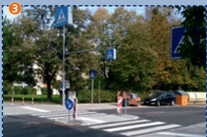
Fußgängerüberweg am Stiftsbogen Durch die Umgestaltung des Übergangs mit Zebrastreifen und Verkehrsinsel wurde die Sicherheit des Schulwegs stark erhöht.