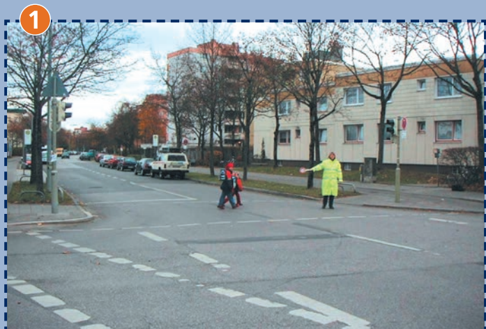
Kreuzung Großhaderner Straße/Guardinistraße