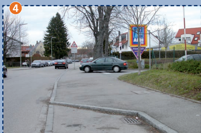
Parkplatzausfahrt der ALDI-Filiale in der Großhaderner Straße