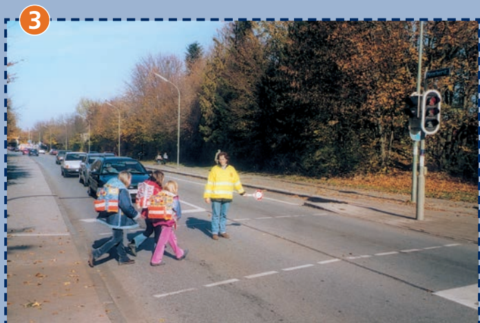
Meyerbeerstraße am Durchblick