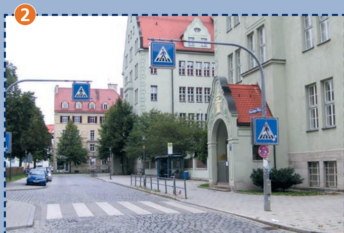
Zebrastreifen Gotzinger Platz