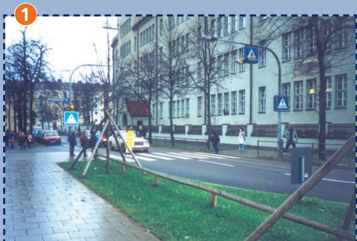
Fußgängerübergang Thalkirchner Straße