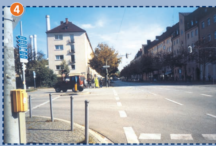
Kreuzung Brudermühlstraße/Thalkirchner Straße, Blick nach Osten