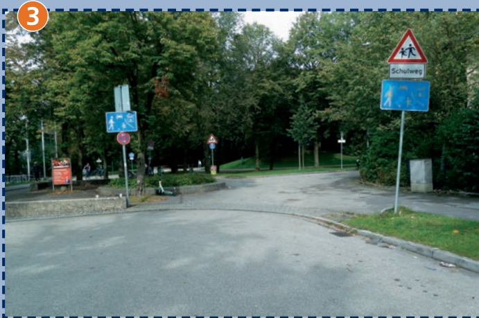
Sehr enger und belebter Wendebereich vor dem Schulhaus, teilweise parkende Autos