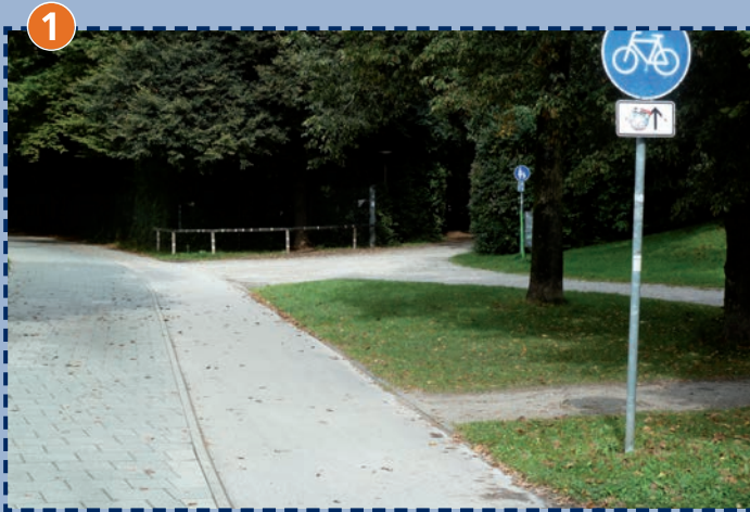
Fahrradweg vor dem Schulhaus in beide Richtungen