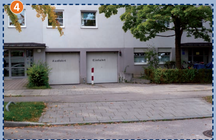
Viele Ein- und Ausfahrten entlang der Gilmstraße