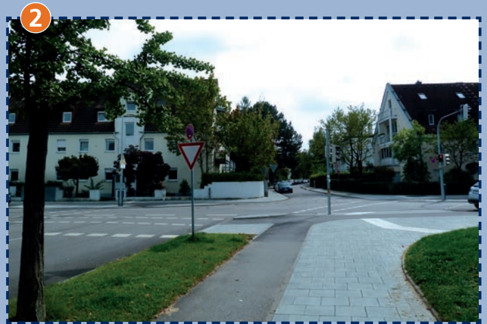
Kreuzung Ehrwalder Straße/Gilmstraße – Druckknopfampel