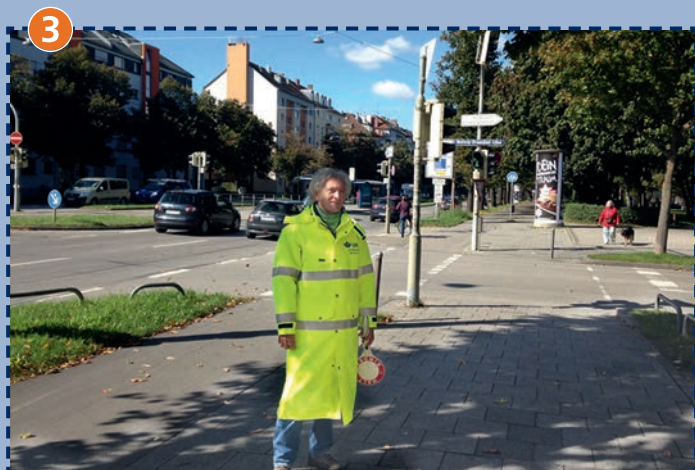
Kreuzung Dachauer Straße/Hedwig-Dransfeld-Allee