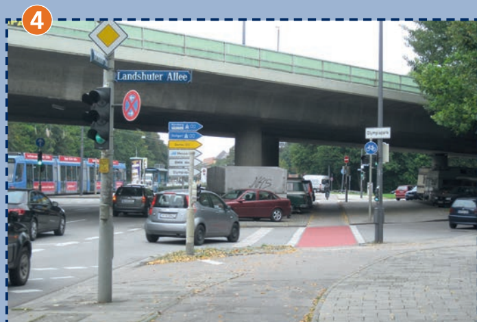
Kreuzung Dachauer Straße/Landshuter Allee