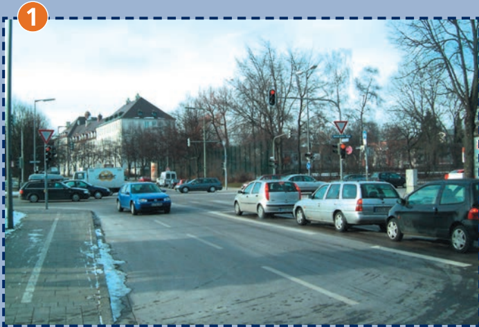
Innsbrucker Ring/Kirchseeoner Straße/Hechtseestraße