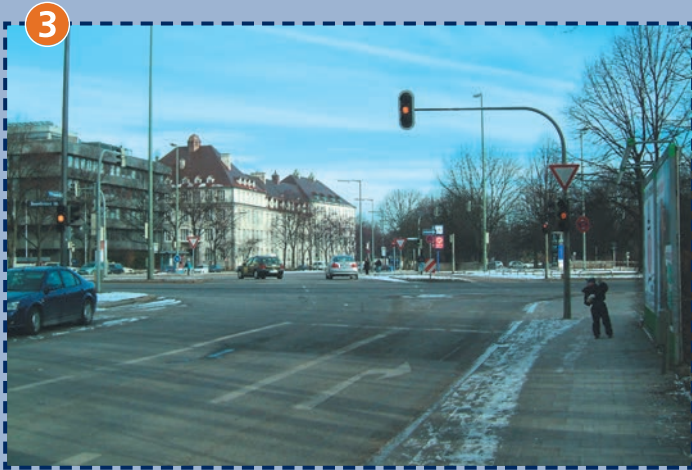
Wilramstraße/Rosenheimer Straße/Kirchseeoner Straße