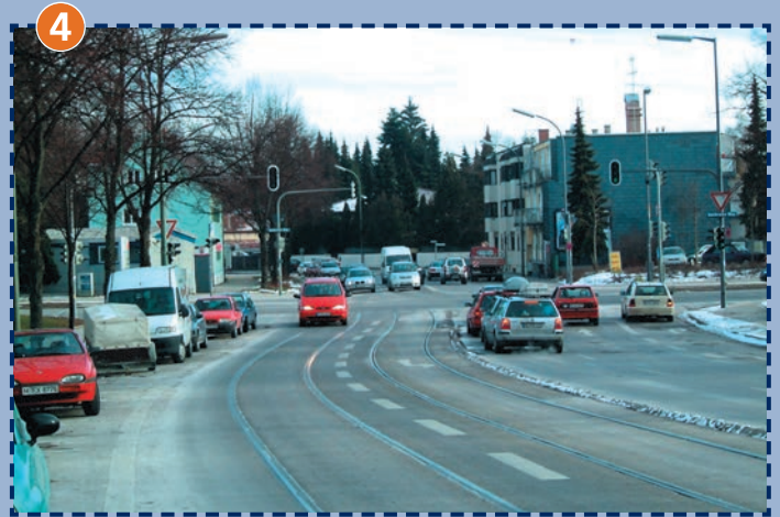
Innsbrucker Ring/Kirchseeoner Straße/Hechtseestraße