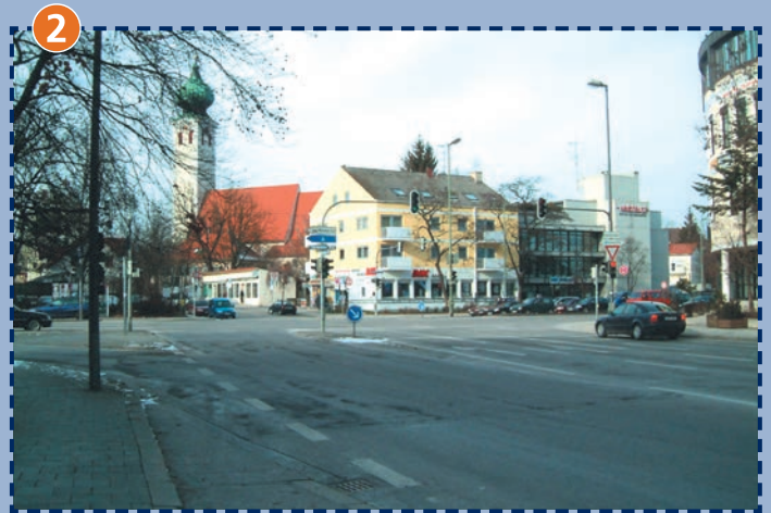
Innsbrucker Ring/Ottobrunner Straße/Aribonenstraße