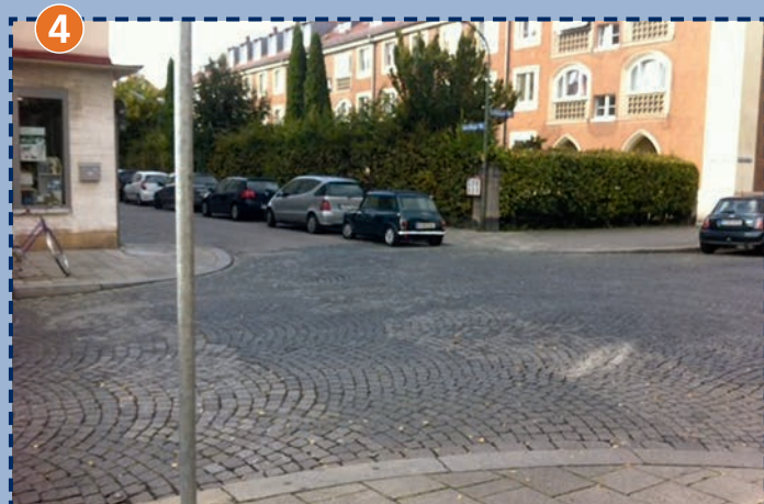
Ecke Echinger Straße/ Garching Straße (kein Zebrastreifen!)