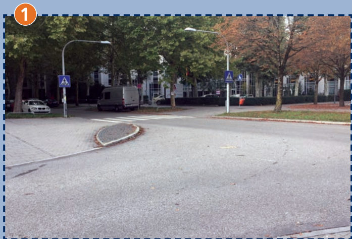
Ecke Schinkelstraße/Berliner Straße