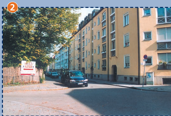
Ecke Fröttmaninger-/Garching Straße (kein Zebrastreifen!)