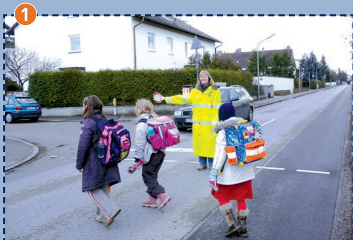
Einmündung Neusatzer Straße/Feldbergstraße