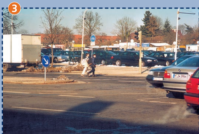
Kreuzung Feldbergstraße/Wasserburger Landstraße