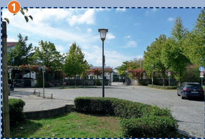
Wendehammer vor der Schule