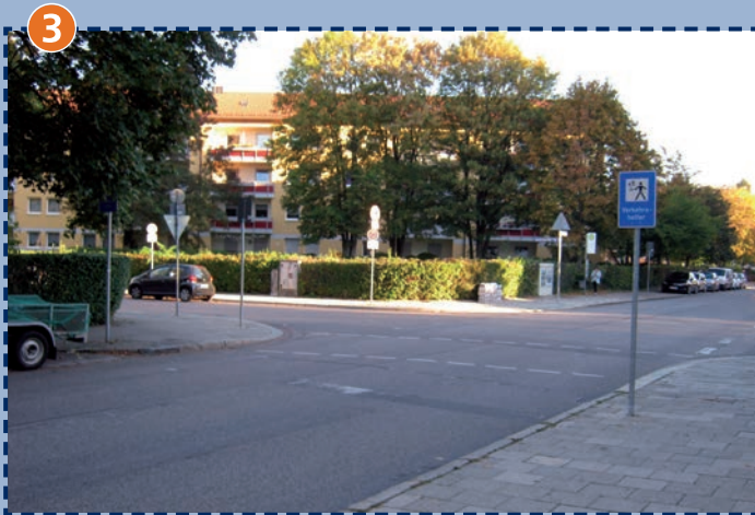
Bingener Straße/ Andernacher Straße