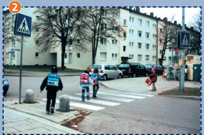
Ehrenbreitsteiner Straße/Andernacher Straße