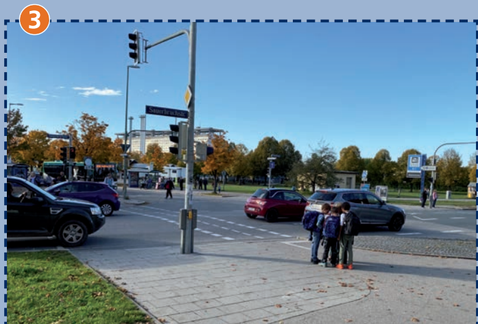
Überweg Sauerbruch-/Pfingstrosenstraße am Max-Lebsche-Platz