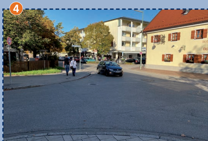
Marchionini-/Heighofstraße – reger Geschäftsverkehr und Marktbereich