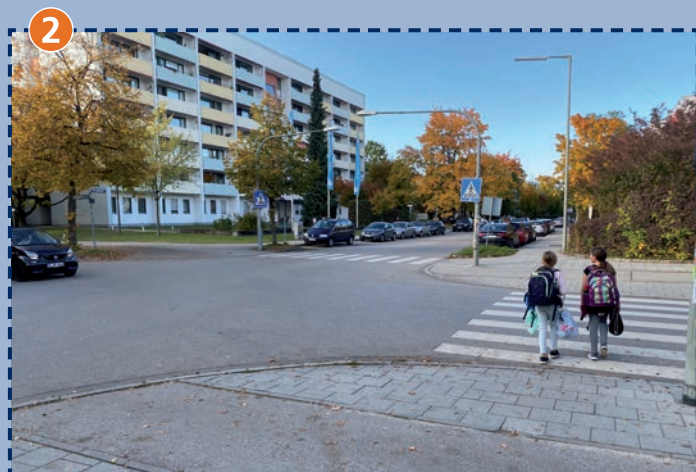
Fußgängerübergang an der Kreuzung Pfingstrosen-/Heighofstraße. Bitte benutzen!