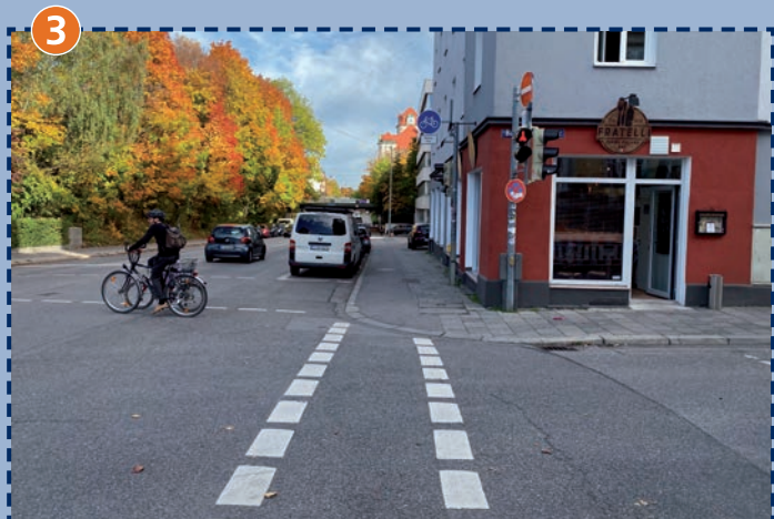
3 Einmündung Baierbrunner Straße/Boschetsrieder Straße Vorsicht bei abbiegenden Fahrzeugen!