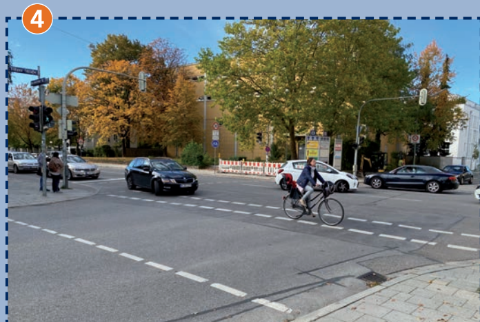
4 Kreuzungsbereich Boschetsrieder Straße/Tölzer Straße