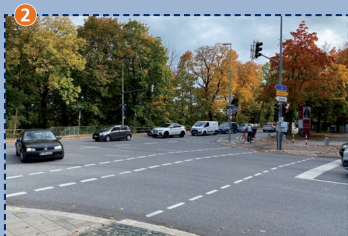
2 Kreuzungsbereich Wolfratshausener Straße/Boschetsrieder Straße