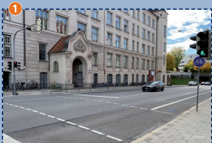
1 Ampel Boschetsrieder Straße (gegenüber dem Schulhaus, vor Unterrichtsbeginn)