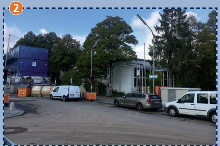
Ecke Schaffhauser Straße/Winterthurer Straße