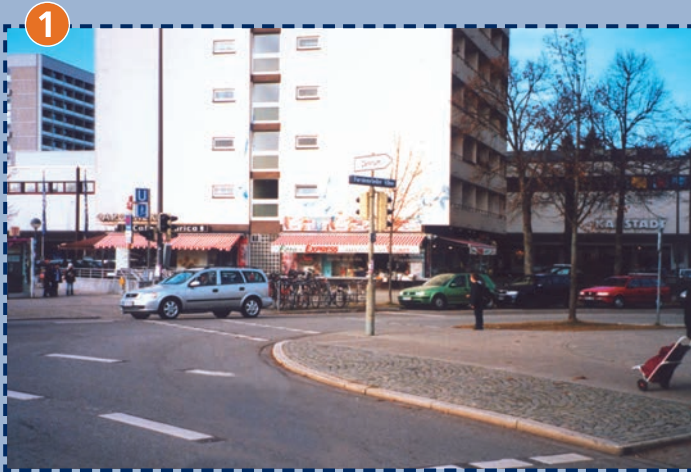
Übergang Forstenrieder Allee