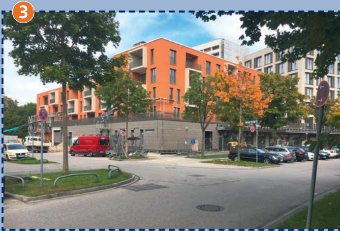
Übergang Berner Straße