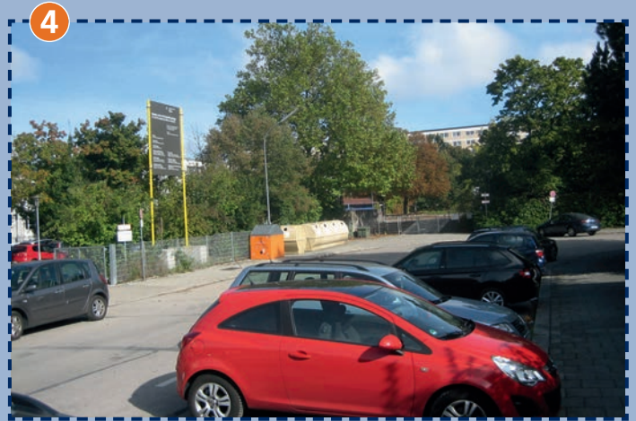
Kurve am Eingang Berner Straße