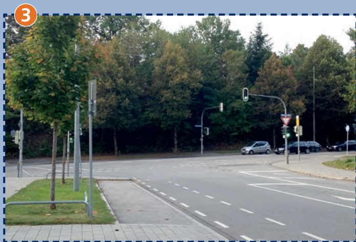
3 Siemensallee/Baierbrunner Straße Vorsicht: Abbiegende Fahrzeuge!