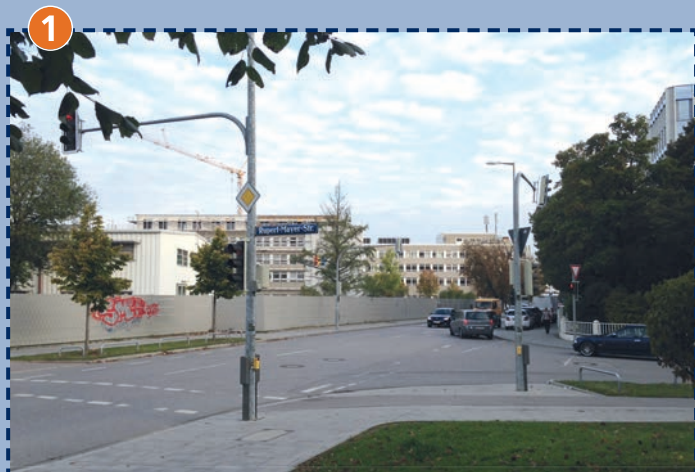
1 Baierbrunner Straße/Rupert-Mayer-Straße Vorsicht: Abbiegende Fahrzeuge!