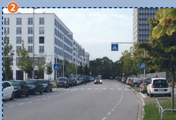
2 Fußgängerüberweg Baierbrunner Straße 63 Vorsicht: Parkende Fahrzeuge verhindern eine freie Sicht!