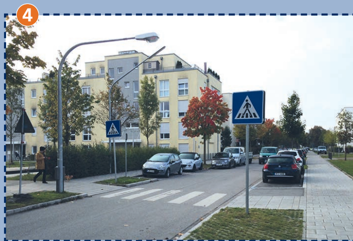
4 Fußgängerüberweg St.-Wendel-Straße Vorsicht: Morgens viel Verkehr und rangierende Fahrzeuge!