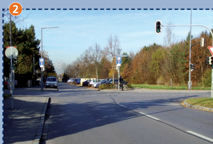
Kreuzung Alte Allee/Bergsonstraße