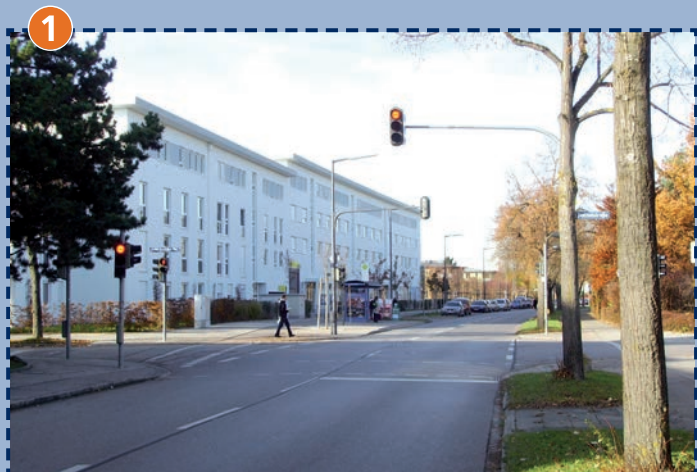
Kreuzung Peter-Kreuder-Straße/Petzetstraße/Alte Allee