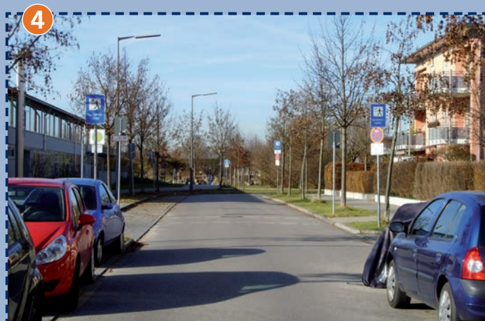
An der Schäferwiese - Verkehrshelferübergang