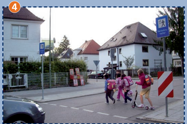
Verkehrshelferübergang Netzerstraße/Warschauer Straße