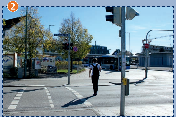
Memminger Platz/Bahnunterführung: benütze die Druckknopfampel.