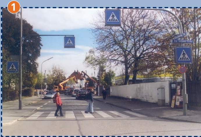
Donauwörther Straße/Zur Grünen Eiche: gehe über den Zebrastreifen.