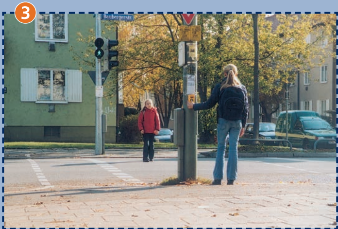
Großbeerenstraße/Bauberger-/Karl-Lipp-Straße: benütze die Druckknopfampel.