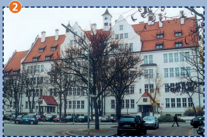
Schule am Agilolfingerplatz - Ostseite