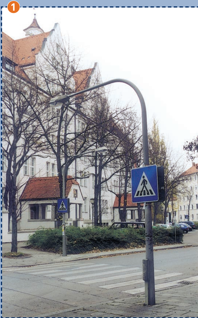
Schule am Agilolfingerplatz - Südostseite