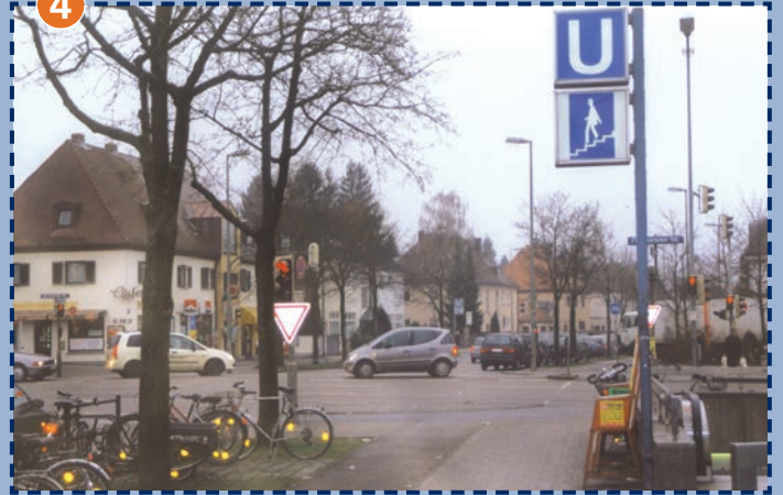
Fürstenrieder Straße/Ehrwalder-Straße U-Bahn-Unterführung Holzapfelkreuth